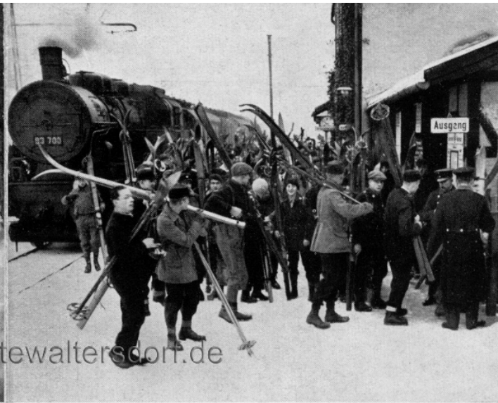
Ankunft der Sportler in Wüstewaltersdorf

den Wolfsberg mit Jauernig, um den Spitzberg mit Friedersdorf, um den Hohen Hahn mit Heinrichau, um den Hergenstein mit Hausdorf und Mühlbachtal. Mannigfach sind auch die Wege auf der Hohen Eule selbst, auf denen man bald allem Sonntagsverkehr entrückt ist.