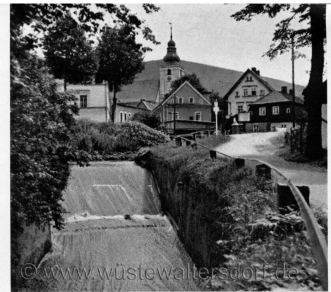
Motiv aus Wüstewaltersdorf im Hintergrund die H. Eule

Die hohe Eule mit dem Kanonenwege, wo alte Schützengräben und Feldstellungen noch von Friedrich des Großen Heldenkampf um Schlesiens Künden.