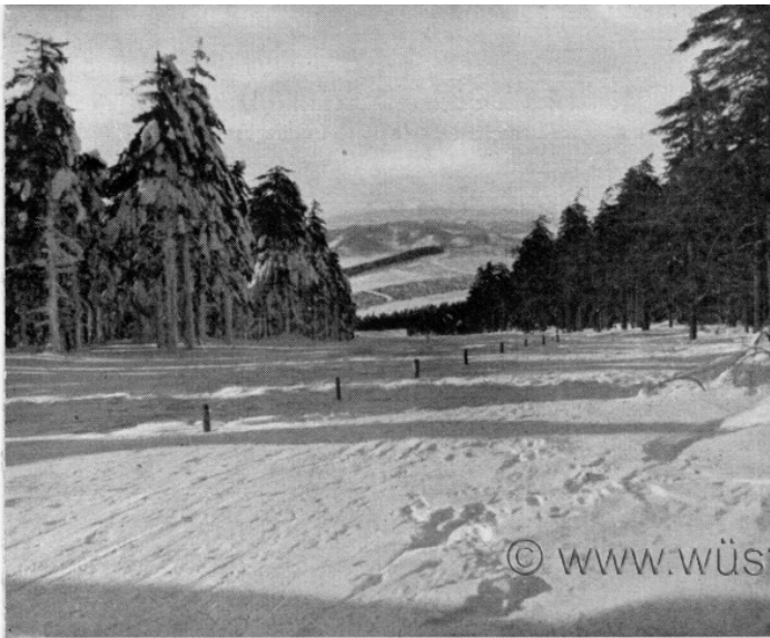
Eulefamm mit Blick nach der Schneetoppe

Von den Siebenkurfürsten durch den Eulegrund