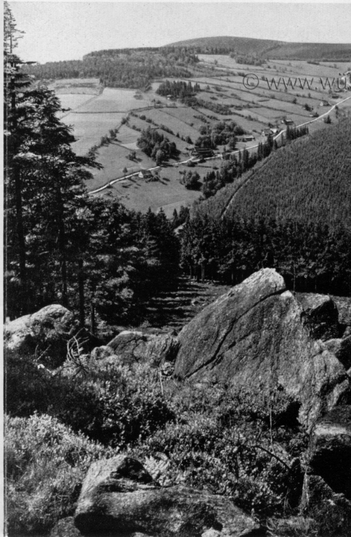
Eulekamm mit Euledörfel